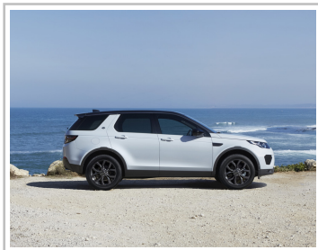
Land Rover Discovery Sport Landmark Edition.