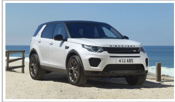
Land Rover Discovery Sport Landmark Edition.