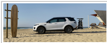
Land Rover Discovery Sport Landmark Edition.