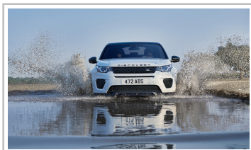
Land Rover Discovery Sport Landmark Edition.