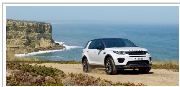
Land Rover Discovery Sport Landmark Edition.