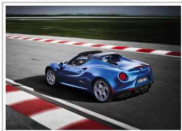
Alfa Romeo 4C Spider Italia.