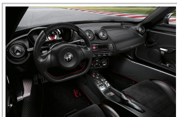
Alfa Romeo 4C Competizione.