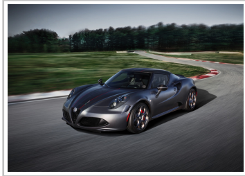
Alfa Romeo 4C Competizione.