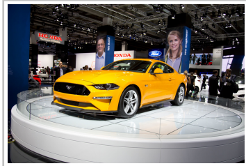
Ford Mustang GT.