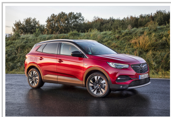
Opel Grandland X.