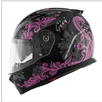
Givi Tridion 50.5 „Decó“.