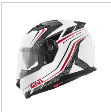
Givi Tridion 50.5 „Raptor“.