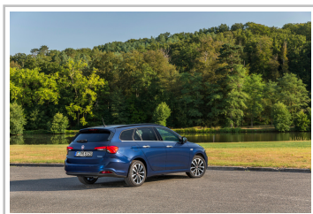
Fiat Tipo Kombi.