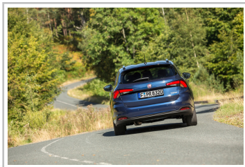
Fiat Tipo Kombi.