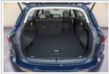
Fiat Tipo Kombi.