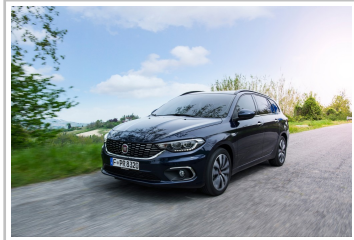
Fiat Tipo Kombi.