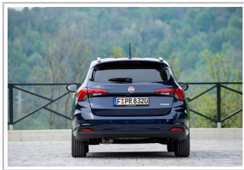
Fiat Tipo Kombi.