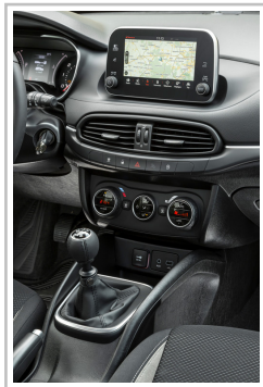
Fiat Tipo Kombi.