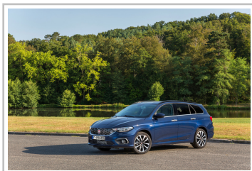
Fiat Tipo Kombi.