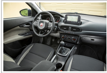
Fiat Tipo Kombi.