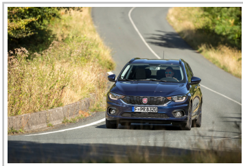
Fiat Tipo Kombi.