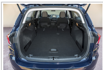
Fiat Tipo Kombi.