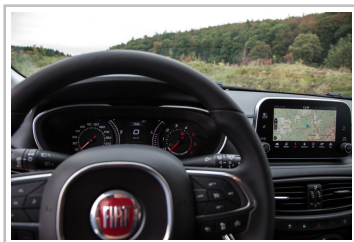
Fiat Tipo Kombi.