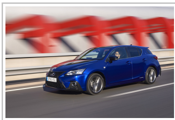
Lexus CT 200h F-Sport.