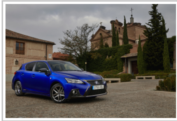
Lexus CT 200h F-Sport.