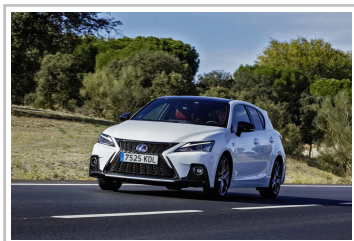
Lexus CT 200h.