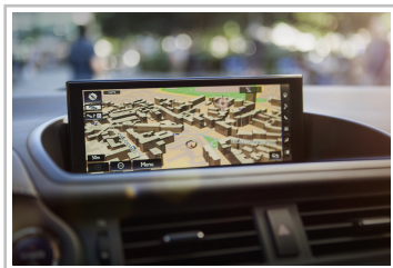
Lexus CT 200h F-Sport.