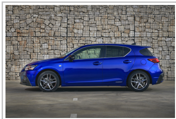
Lexus CT 200h F-Sport.