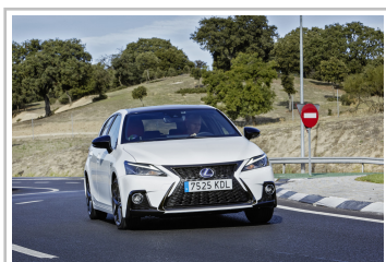
Lexus CT 200h.