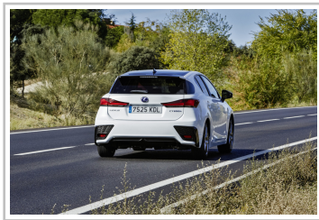
Lexus CT 200h.