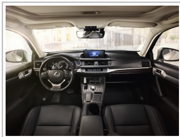
Lexus CT 200h F-Sport.