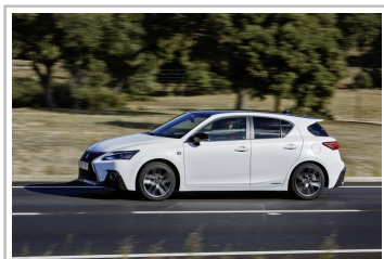
Lexus CT 200h.