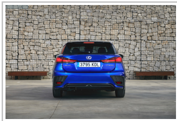
Lexus CT 200h F-Sport.