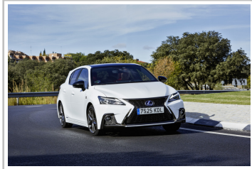
Lexus CT 200h.