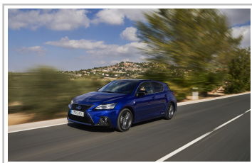
Lexus CT 200h F-Sport.