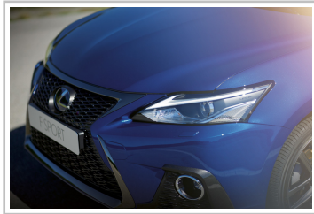
Lexus CT 200h F-Sport.