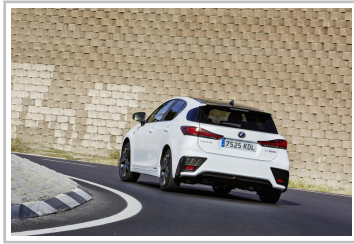
Lexus CT 200h.