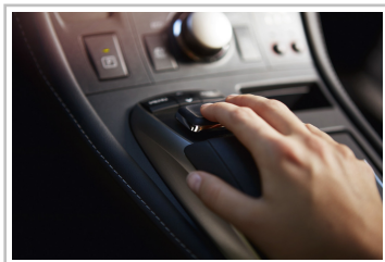
Lexus CT 200h F-Sport.