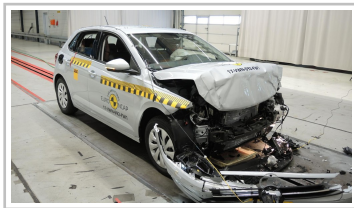
VW Polo im Euro-NCAP-Crashtest.