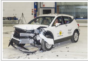
Seat Arona im Euro-NCAP-Crashtest.