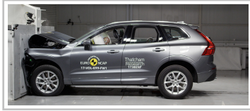
Volvo XC60 im Euro-NCAP-Crashtest.