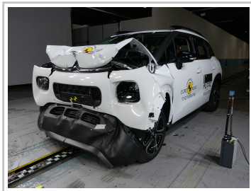
Citroën C3 Aircross im Euro-NCAP-Crashtest.