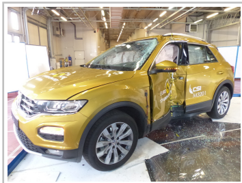
VW T-Roc im Euro-NCAP-Crashtest.