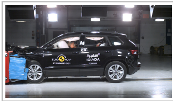
Skoda Karoq im Euro-NCAP-Crashtest.