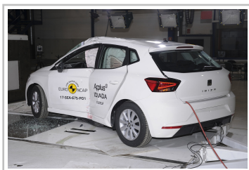
Seat Ibiza im Euro-NCAP-Crashtest.