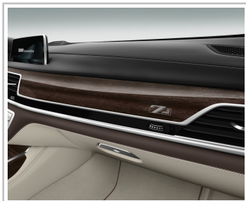
BMW 7er Edition 40 Jahre.