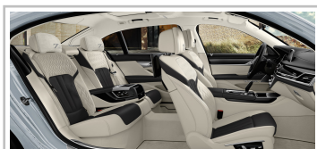
BMW 7er Edition 40 Jahre.