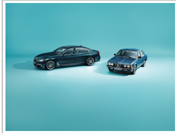
BMW 7er Edition 40 Jahre und der Ur-7er (1977).