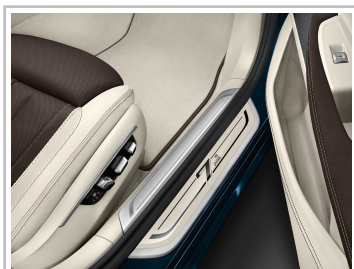
BMW 7er Edition 40 Jahre.