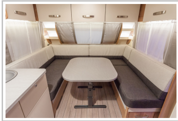
Weinsberg Caraone Ice