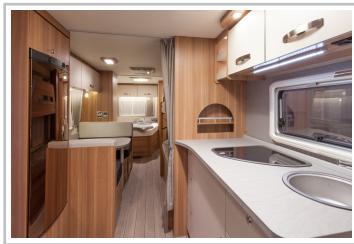
Weinsberg Caraone Ice