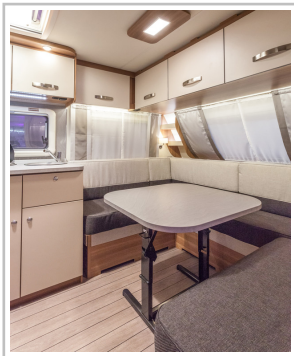
Weinsberg Caraone Ice