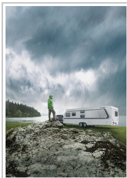
Weinsberg Caraone Ice