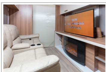
Weinsberg Caraone Ice