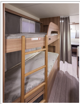
Weinsberg Caraone Ice