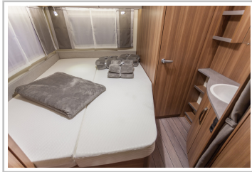
Weinsberg Caraone Ice