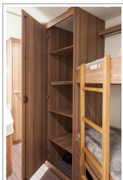
Weinsberg Caraone Ice