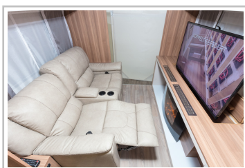
Weinsberg Caraone Ice