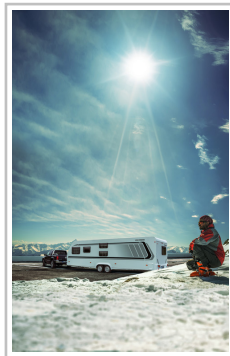
Weinsberg Caraone Ice