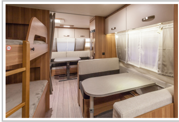
Weinsberg Caraone Ice