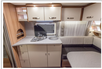
Weinsberg Caraone Ice