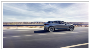
Jaguar I-Pace Concept.