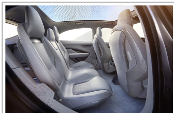
Jaguar I-Pace Concept.