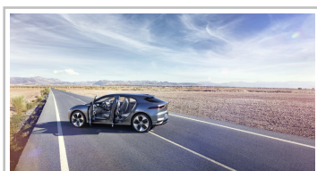
Jaguar I-Pace Concept.