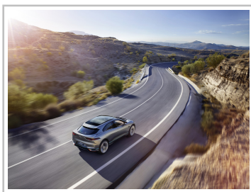
Jaguar I-Pace Concept.