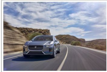
Jaguar I-Pace Concept.