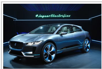
Jaguar I-Pace Concept.