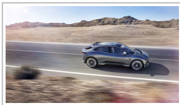
Jaguar I-Pace Concept.