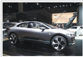
Jaguar I-Pace Concept Car.