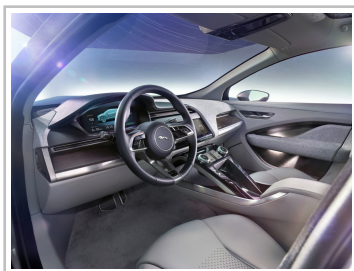
Jaguar I-Pace Concept.