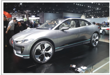
Jaguar I-Pace Concept Car.