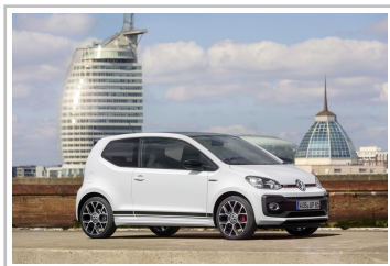
Volkswagen Up GTI.