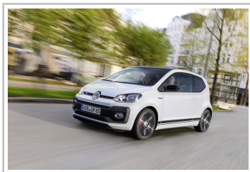
Volkswagen Up GTI.