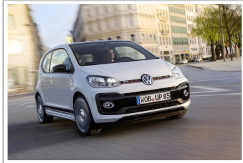
Volkswagen Up GTI.