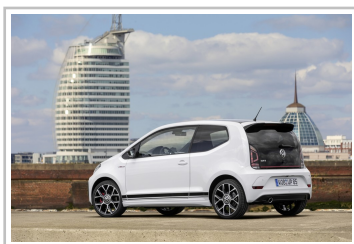
Volkswagen Up GTI.