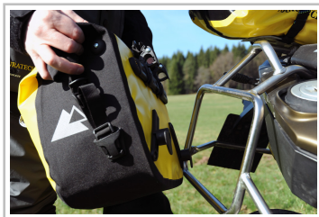
Motorrad-Seitentasche Touratech Endurance Click.