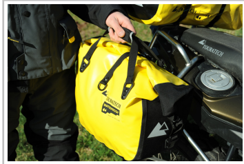
Motorrad-Seitentasche Touratech Endurance Click.