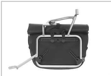
Motorrad-Seitentasche Touratech Endurance Click.