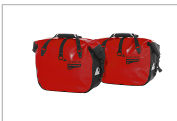
Motorrad-Seitentaschen Touratech Endurance Click.