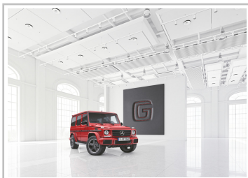
Mercedes-Benz G-Klasse Designo Manufaktur Edition.