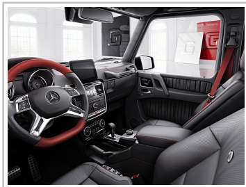
Mercedes-Benz G-Klasse Designo Manufaktur Edition.