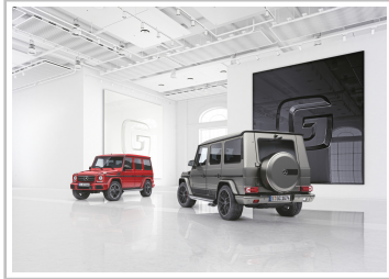
Mercedes-Benz G-Klasse Designo Manufaktur Edition (links) und Exclusive Edition.