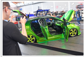
Tuning World Bodensee 2017.