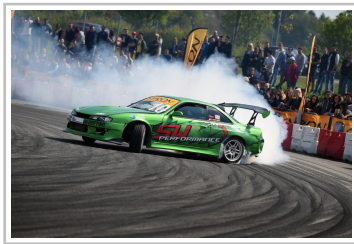
Tuning World Bodensee 2017.