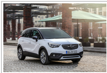
Opel Crossland X.