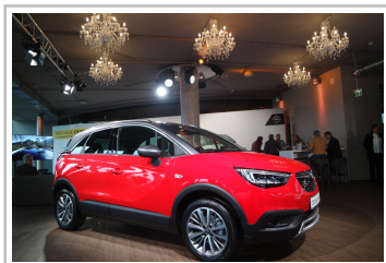
Opel Crossland X.