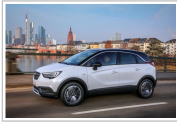
Opel Crossland X.