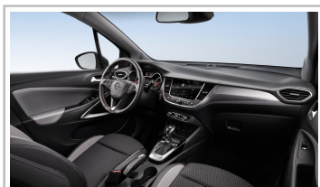
Opel Crossland X.