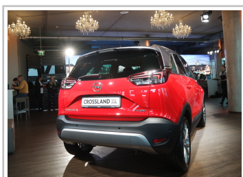
Opel Crossland X.