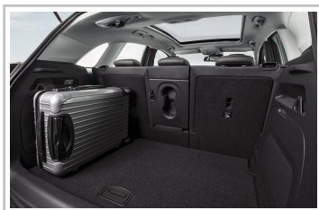
Opel Crossland X.