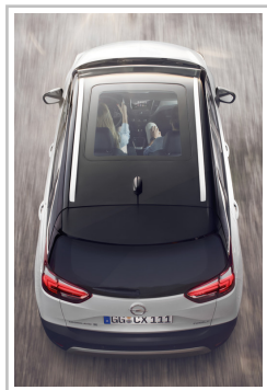
Opel Crossland X.