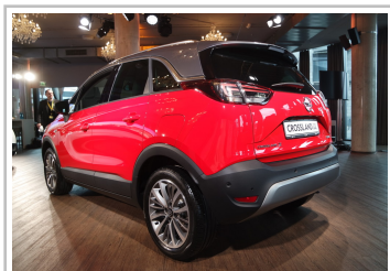
Opel Crossland X.