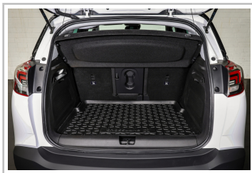
Opel Crossland X.