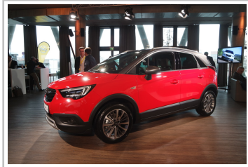
Opel Crossland X.