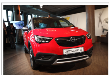
Opel Crossland X.