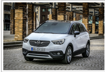
Opel Crossland X.