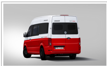
Knaus Tabbert Crafter.