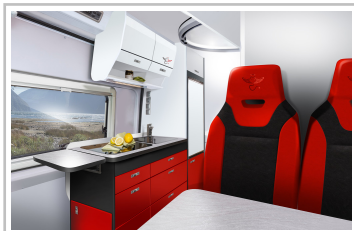
Knaus Tabbert Crafter.