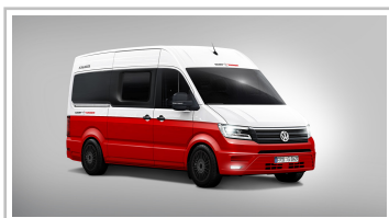
Knaus Tabbert Crafter.