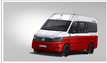
Knaus Tabbert Crafter.