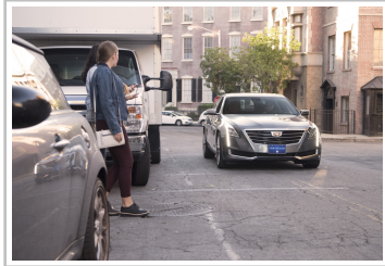
X2Safe von ZF.