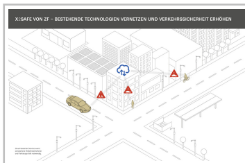
X2Safe von ZF.