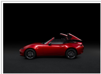
Mazda MX-5 RF Ignition.