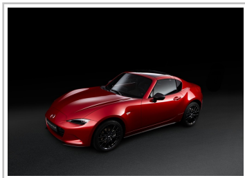
Mazda MX-5 RF Ignition.