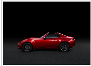
Mazda MX-5 RF Ignition.