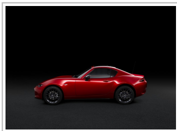
Mazda MX-5 RF Ignition.