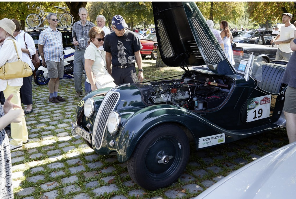
BMW feiert 100 Jahre Unternehmensgeschichte: Die Clubs brachten rund 1000 Oldtimer