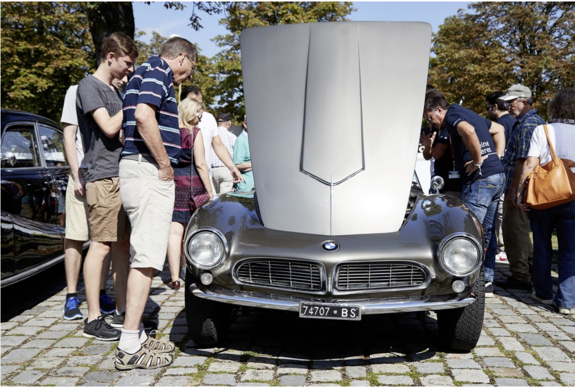
BMW feiert 100 Jahre Unternehmensgeschichte: Die Clubs brachten rund 1000 Oldtimer der Marke nach München mit.