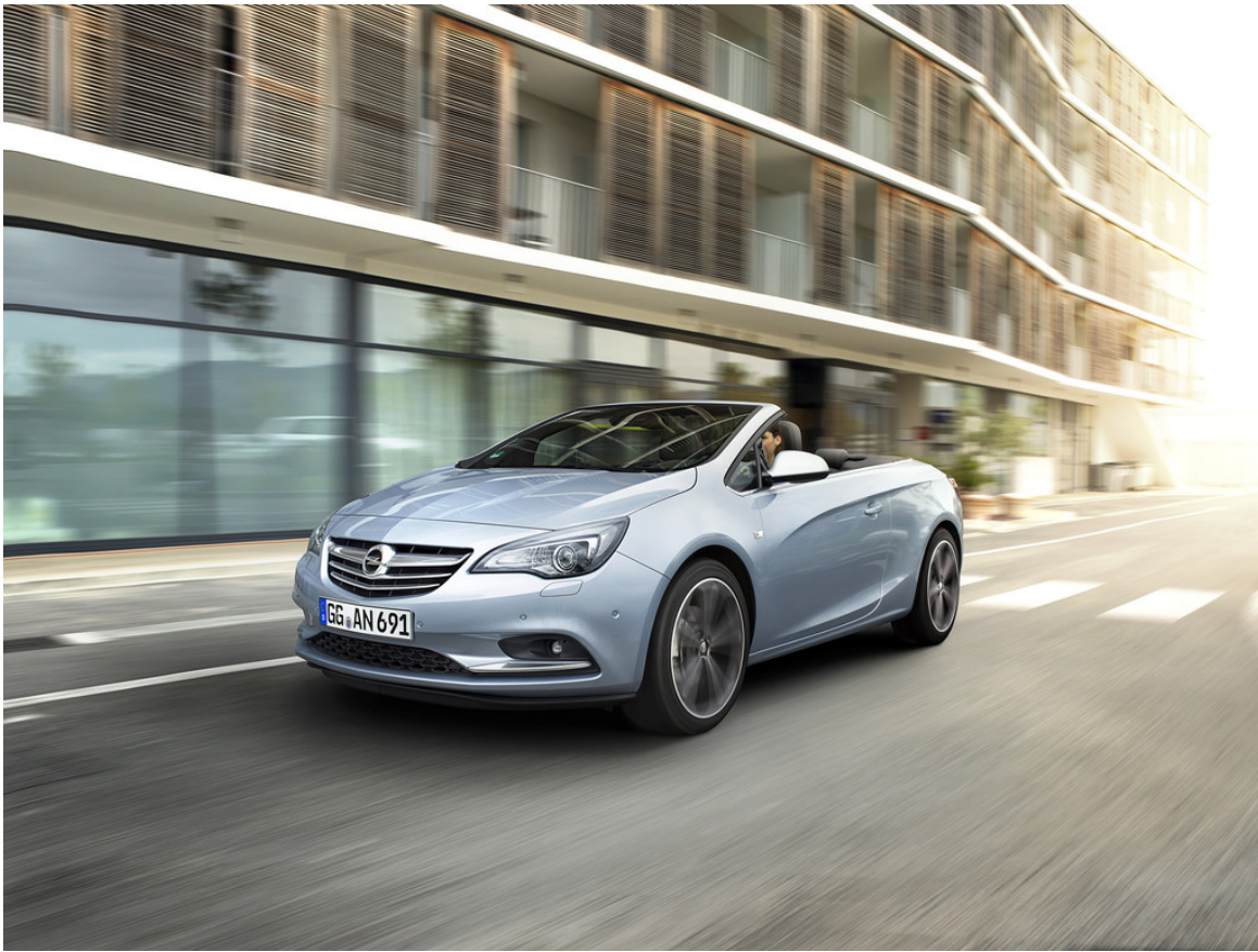
Opel Cascada 2.0 CDTI.