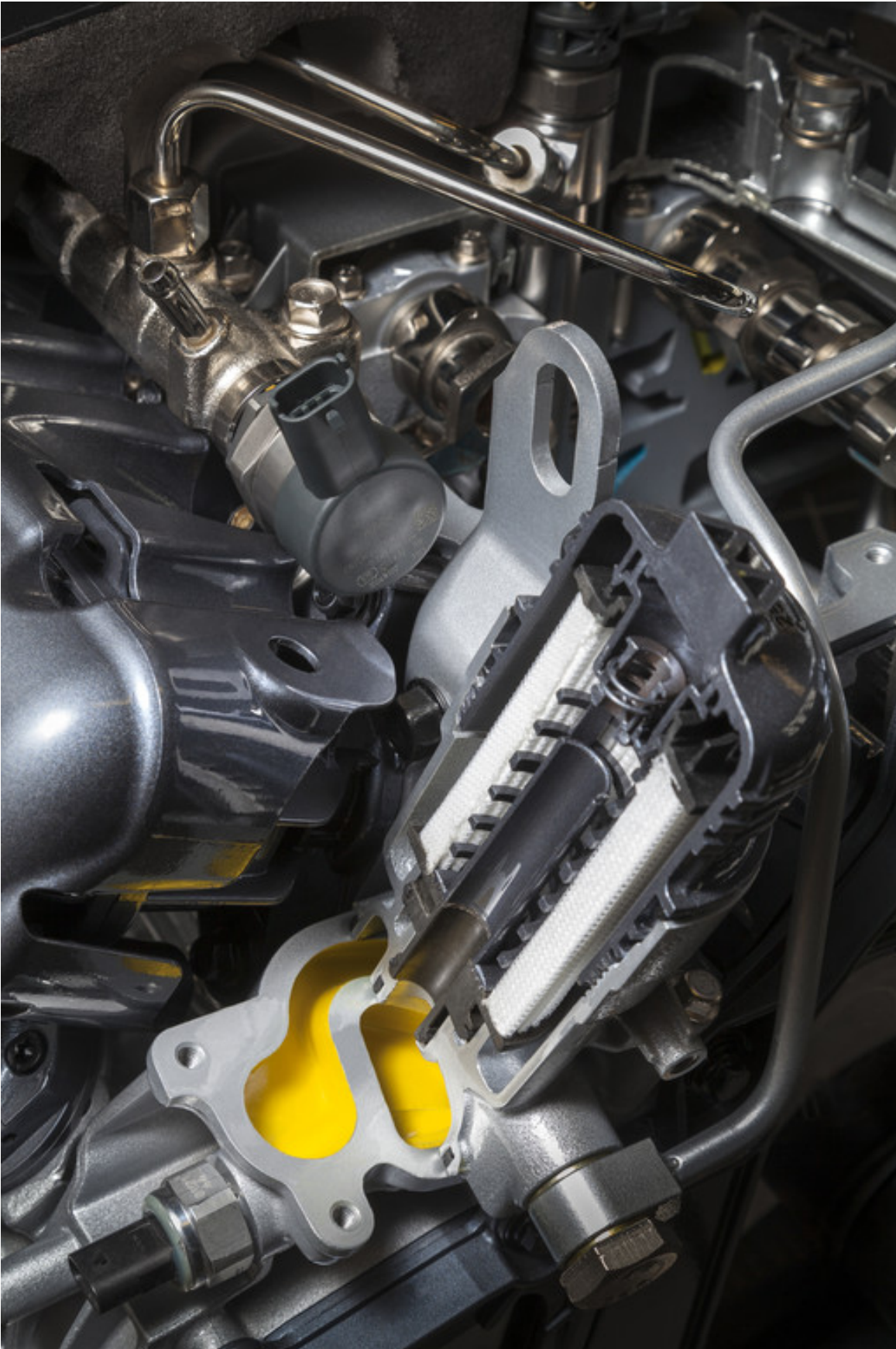
2.0-CDTI-Motor von Opel: Der Turbolader verfügt über Wasserkühlung, ein separater Ölfilter (Foto) schützt die Lager zusätzlich vor Verschleiß.