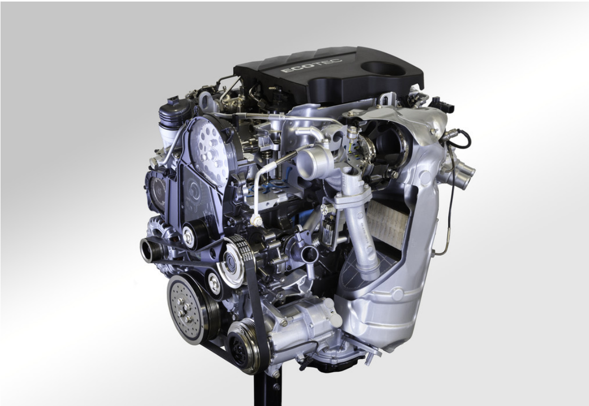
2.0-CDTI-Motor von Opel mit 125 kW/170 PS.