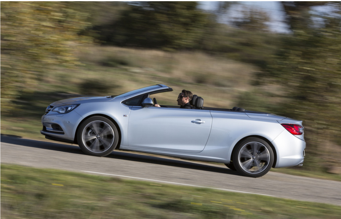
Opel Cascada 2.0 CDTI.