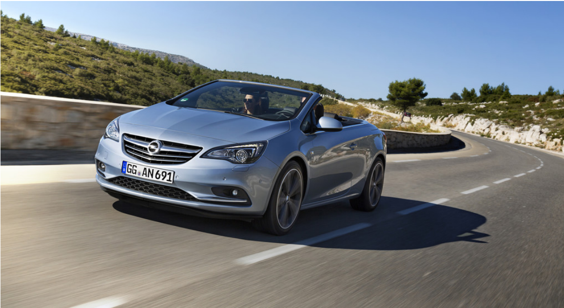
Opel Cascada 2.0 CDTI.