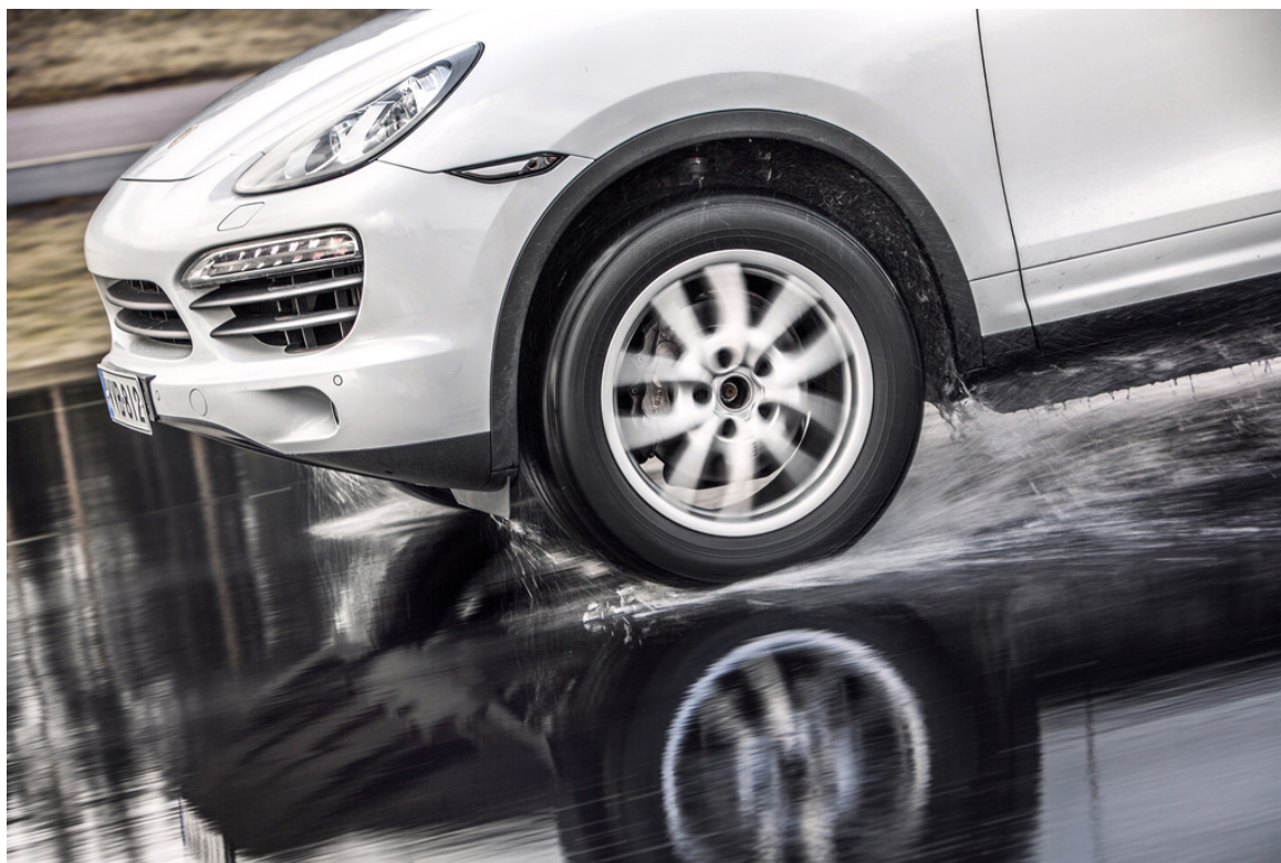
Nokian WR SUV 3.