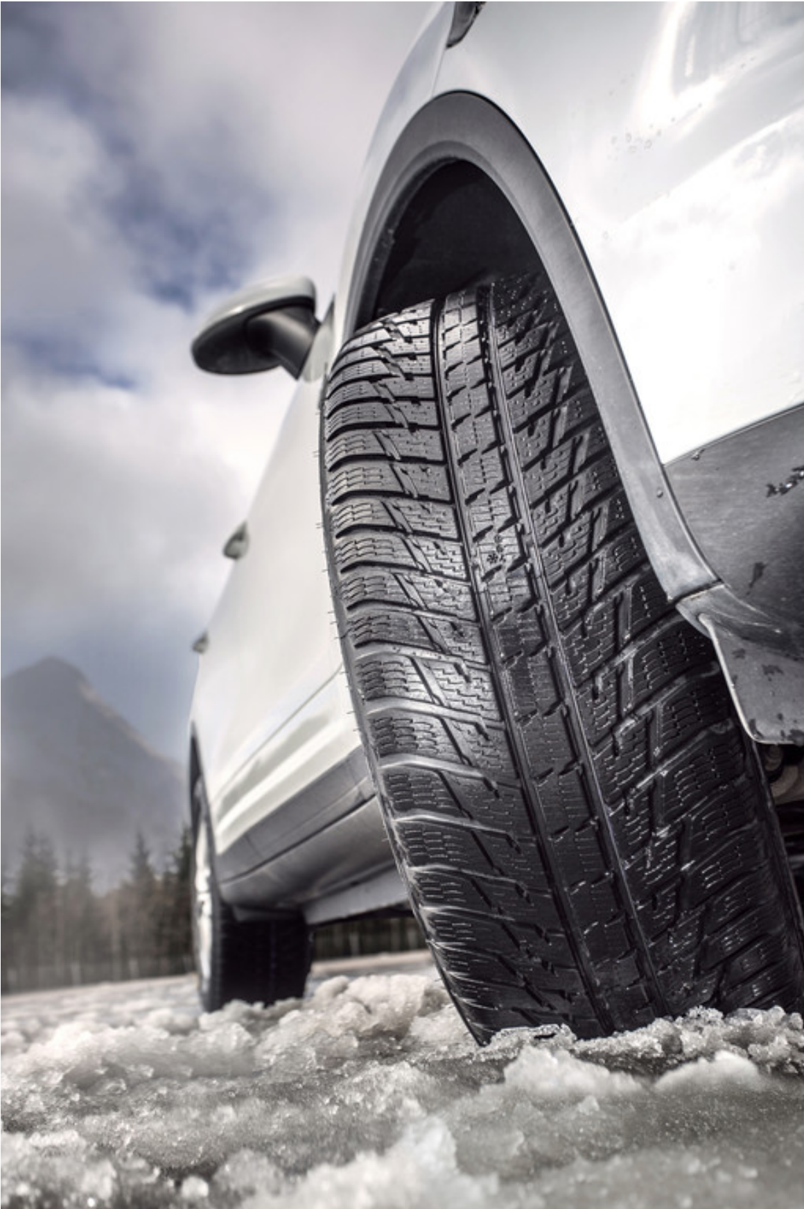
Nokian WR SUV 3.