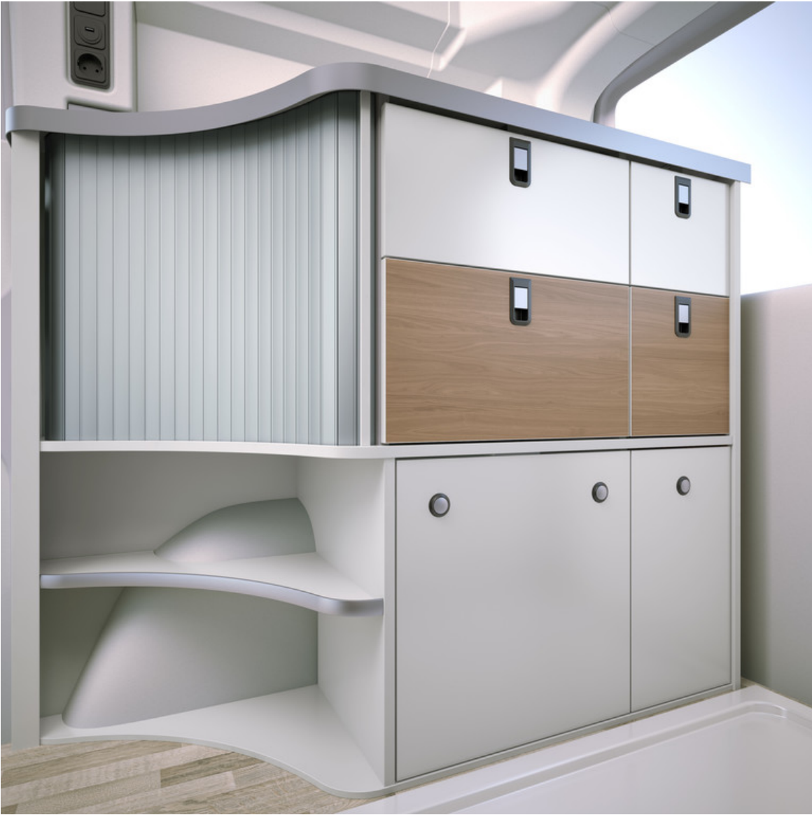
Westfalia Club Joker.