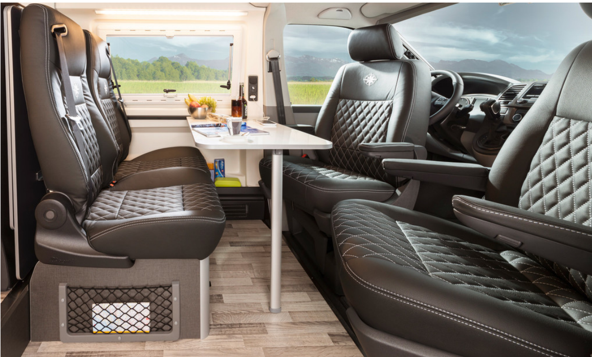
Westfalia Club Joker.