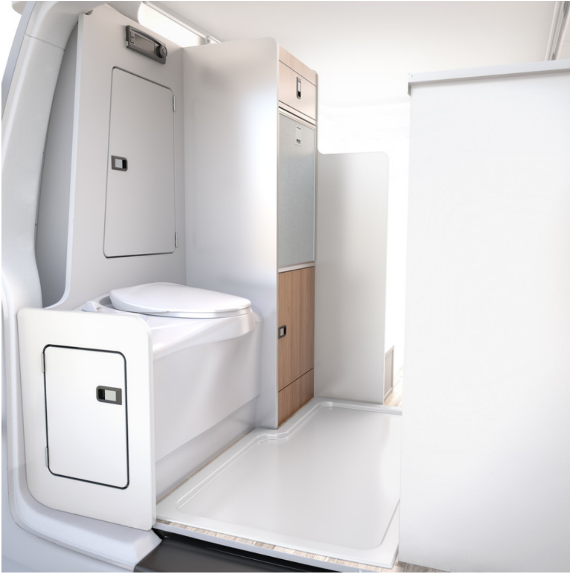
Westfalia Club Joker.