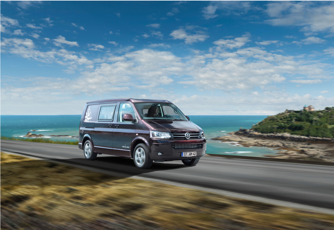
Westfalia Club Joker.