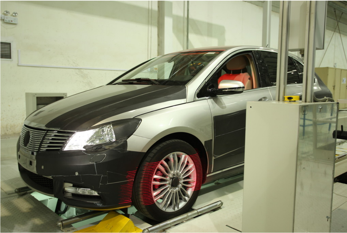
Leicht getarnter Denza auf dem Prüfstand.