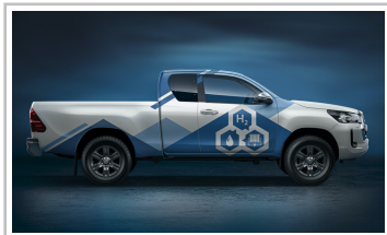
Toyota Hilux mit Brennstoffzellenantrieb.