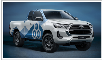
Toyota Hilux mit Brennstoffzellenantrieb.