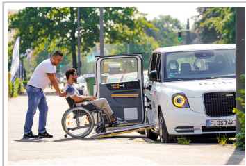
LEVC TX (London Taxi) von Ioki.