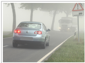
Fahren bei Nebel.