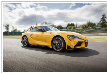
Toyota GR Supra.