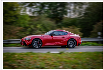
Toyota Supra GR.