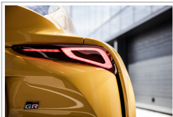
Toyota GR Supra.