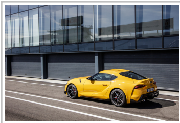
Toyota GR Supra.